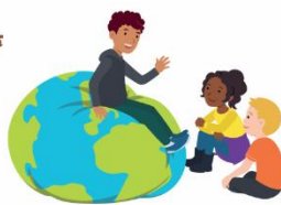
We hebben oor voor elkaar