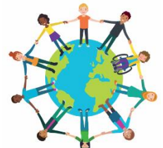
We zijn allemaal anders