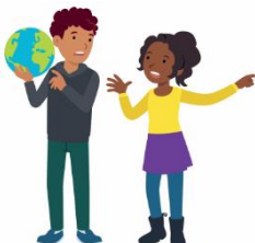
We lossen conflicten zelf op