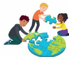
We dragen allemaal een steentje bij