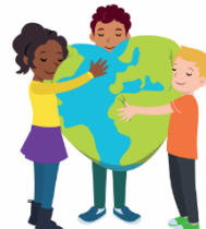
We hebben hart voor elkaar